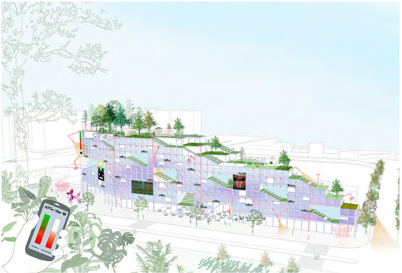
Une eComapplus connecte le bâtiment et rend son usage visible et mutualisable © DGT. (DORELL.GHOTMEH. TANE / ARCHITECTS)

La bâtiment accueille une salle de sport mais aussi une Zen Zone pour permettre de s'isoler des champs électromagnétiques des appareils Wifi et GSM.